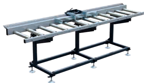
EXAKT EXTRA STABIL-B/KF