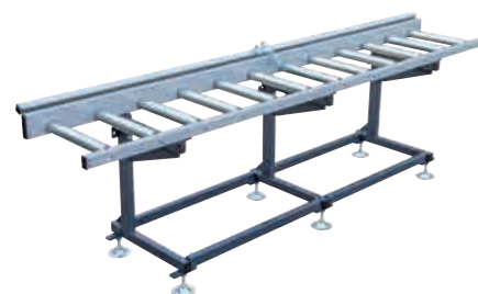
EXAKT EXTRA STABIL-B