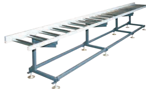
EXAKT EXTRA STABIL-C

ZUBEHÖR // AB S.12+13: EXAKT ES ALLE VERSIONEN ■ Abdeckblech (ART.-NR.: SZ06) ■ Sonderhöhe über Füße (ART.-NR.: SZ 27); Sonderhöhe mit Spindel (ART.-NR.: SZ 28) ■ Ausziehbare Materialauflage (ART.-NR.: SZ 35) ■ Materialanschlag gefedert, fest (ART.-NR.: SZ 04) ■ Kunststofftragrollen 500 mm Bahnbreite (ART.-NR.: SZ 38); 400 Bahnbreite (ART.-NR.: SZ 37)