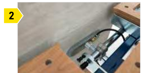
2 Vakuum-Spanneinheit mit zwei verschiebbaren Ovalgreifern mit Tastventil.