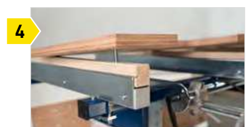
4 Arbeitsplatte schnell und einfach abnehmbar für individuellen Einsatzzweck.