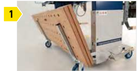
1 Auflagen hinten für das Ablegen der Arbeitsplatten.

DAS MACHT DIE SUPPORTER AM 500-FLEXX + AM 1200-FLEXX BESONDERS: