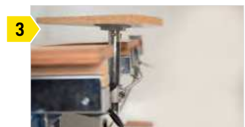
3 Bei Bedarf ist die Vakuum-Spanneinheit unter die Arbeitsplatte wegklappbar.