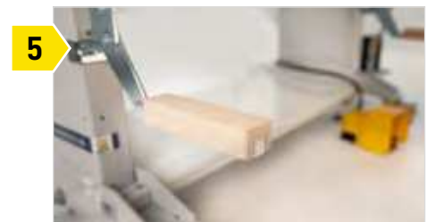
5 Vertikalaufgabe links und rechts verstellbar im 50mm-Schlüsseloch-Raster.

OPTIONAL Lochrasterarbeitsplatte inklusive 2 Ablagehalter ART.-NR.: 210.465.00