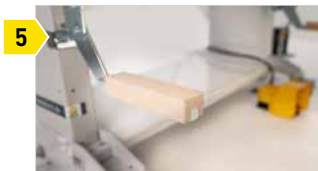
5 Support vertical réglable à gauche et à droite. Réglables par paliers à clé de 50 mm.