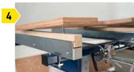
4 Le plan de travail peut être retiré rapidement et facilement selon les exigences.