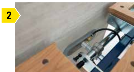
2 Unités de serrage à vide avec deux ventouses coulissantes ovales avec palpeur.