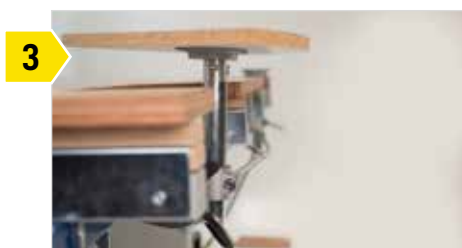
3 Si nécessaire, l'unité de serrage par le vide peut être repliée sous le plan de travail.