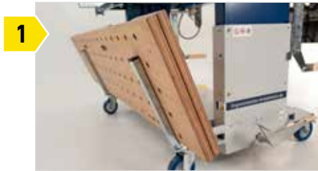
1 Supports arrière pour le dépôt des plateaux de travail.

CE QUI REND SPÉCIALE LES SUPPORTER AM 500-FLEXX + AM 1200-FLEXX :