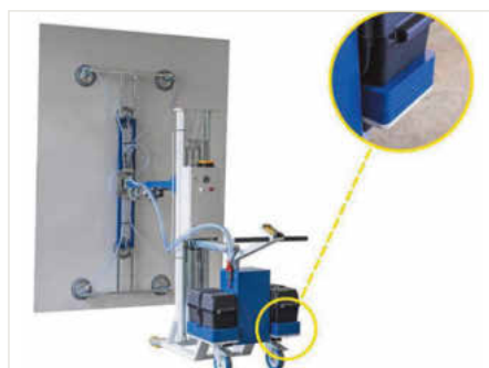
Das Untergestell mit Akku-Unterstützung dient zum Transport über Distanzen hinweg