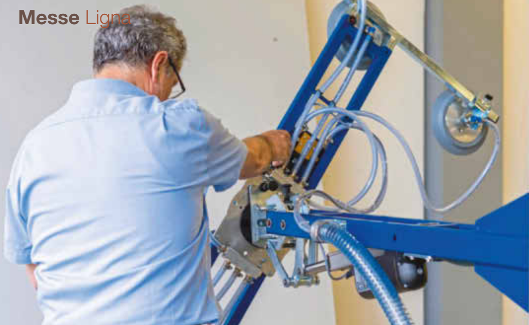
Eine Person genügt mit dem Vakuumlifter, um auch große Platten kräfteschonend zu bewegen