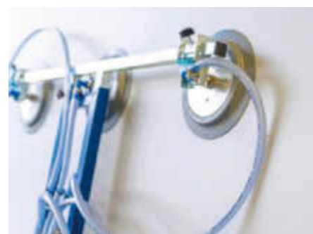
Das Vakuum bleibt ohne Pumpe erhalten, nichts kann versehentlich herunterfallen