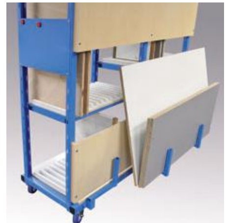
MULTI-CAR Midi - Rückseite mit Option: Plattenträger-Auf-lagearme

Übersichtlich sortiert, lassen sich Platten, Möbeltüren und -fronten in unterschiedlichen Fertigungsstufen schneller erfassen und zuordnen. Rillenplatten an Boden und Rückwänden halten Distanz zwischen den Werkstücken und schützen dadurch auch empfindliche Kanten und Oberflächen.