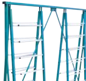
CADDY mit eingeklappten Rechen

Die beidseitig ausklappbaren Auflagerechen sind mit oberflächenschonenden Kunststoffauflagen versehen. Damit ist sichergestellt, dass Platten, Leisten oder Profile pfleglich behandelt werden. Wenn er gerade mal nicht gebraucht wird, macht sich der CADDY ganz klein und wartet unauffällig auf den nächsten Einsatz.